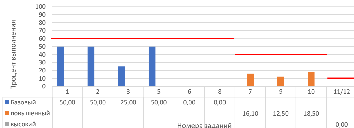
Рисунок 3. Задания, по которым участники не преодолели минимальный порог

На рисунке 3 представлены данные по заданиям (%), уровень выполнения которых не преодолел минимальный порог. Красной линией отражен минимальный порог выполнения для каждого уровня сложности: базовый – 60%, повышенный – 40%, высокий – 10%.